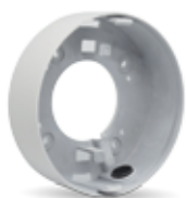
La caja de conexiones (PR-B40DJB) est3

Sensor: Sony de 1/3", 2 megapíxeles Salida seleccionable: 1080P AHD/Anal3gica Lente: Fija de 2,8-12 mm megapíxeles Día/Noche real (ICR) Alcance IR: 20 m (35 unidades) IP66 IK10 a prueba de vandalismo Compatible con CoC Peso: 810 g Alimentaci3n: 12 V CC, 250 mA