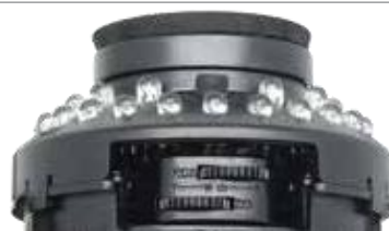
Mecanismo avanzado de ajuste de lentes