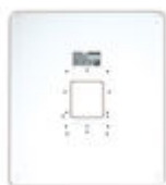
F03389 MARCO UNIVERSAL LARGE