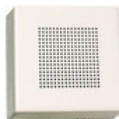
F02040 PROLONGADOR LLAMADA TELEFONO