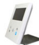
F09420 SOPORTE SOBREMESA MONITOR VEO-XS/VEO-XL