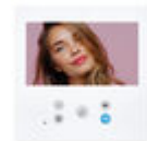
F09469 MONITOR VEO-XL WIFI 7" DUOX PLUS