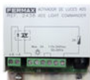
F02438 ACTIVADOR LUCES-TIMBRE VDS