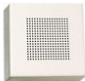
F02040 PROLONGADOR LLAMADA TELEFONO