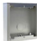
F07061 CAJA SUPERFICIE CITY S1