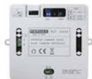
F09444 INTERFAZ CAMARA DUOX PLUS