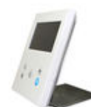
F09420 SOPORTE SOBREMESA MONITOR VEO- XS/VEO-XL