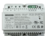
F04826 ALIMENTADOR+FILTRO DIN6 24VDC-1.5A