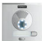
F40708 PLACA CITY S1 CP101 DUOX PLUS