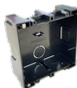
F08948 CAJA EMPOTRAR CITY KIT S1