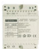
F04802 ALIMENTADOR DIN4 230VAC/12VAC-1A