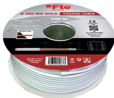
Bobina K 290 WD GOLD